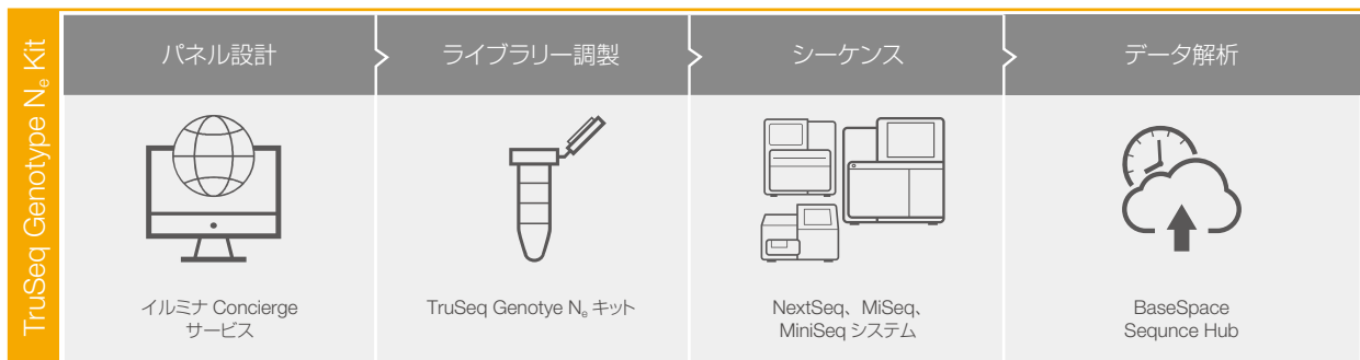
図 1：TruSeq Genotype N 6 Kit のワークフロー カスタムオリゴパネルはイルミナ Concierge サービスにより設計。設計、ライブラリー調製試薬、シーケンス試薬（NextSeq、MiSeq、MiniSeq 対応）までがキットに含まれる。