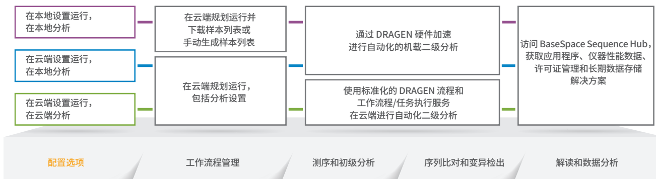
图 3: 灵活的生信分析套件 - NextSeq 1000和NextSeq 2000系统在运行设置、运行管理和数据分析方面,有本地和云端两个选项,能让用户以自己的方式运行测序。