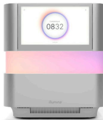
图 1: NextSeq 2000 测序系统——Illumina 最新的 NGS 系统，具有创新的设计、先进的测序化学体系、机载生物信息工具以及简便的工作流程，可在台式测序仪上实现广泛的应用。