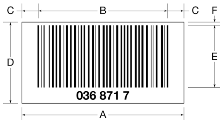
Afbeelding 2 Afmetingen van barcodes