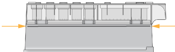
Figura 1 Línea de agua máxima