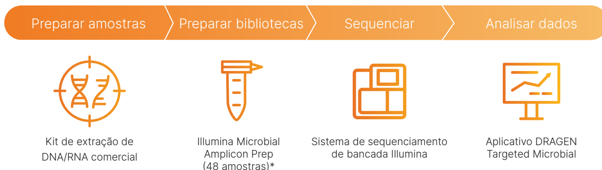
Figura 2: Fluxo de trabalho Illumina Microbial Amplicon Prep — Em um fluxo de trabalho eficiente, as bibliotecas microbianas são preparadas usando o Illumina Microbial Amplicon Prep kit, sequenciadas em qualquer sistema de sequenciamento de bancada da Illumina e analisadas no aplicativo DRAGEN Targeted Microbial para detecção, chamada de variante e tipagem de cepas. *O kit inclui índices para preparação de biblioteca. Oligonucleotídeos de primer devem ser comprados separadamente.