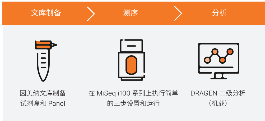
图 2: MiSeq i100 和 MiSeq i100 Plus 基因测序仪提供了直观、简便的分析流程，可简化过渡至 NGS 的过程。