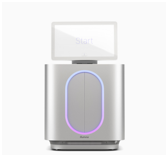
图 1: MiSeq i100 和 MiSeq i100 Plus 基因测序仪——借助专为简便和快速而设计的桌面式基因测序仪，因美纳的创新技术不断扩展 NGS 的可及性。

因美纳每项创新都以客户体验为核心，我们一直尽可能地帮助用户轻松开展文库制备、测序和数据分析。MiSeq i100 系列分析流程经过全方位优化，大幅减少完成项目所需的时间和资源（图 2）。MiSeq i100 和 MiSeq i100 Plus 基因测序仪提供的简化分析流程，仅需三个步骤即可在 20 分钟之内完成运行设置。即插即用装试剂卡盒和耗材可在室温下运输和储存，因此测序前无需等待试剂解冻。直观的信息学分析大幅减少了