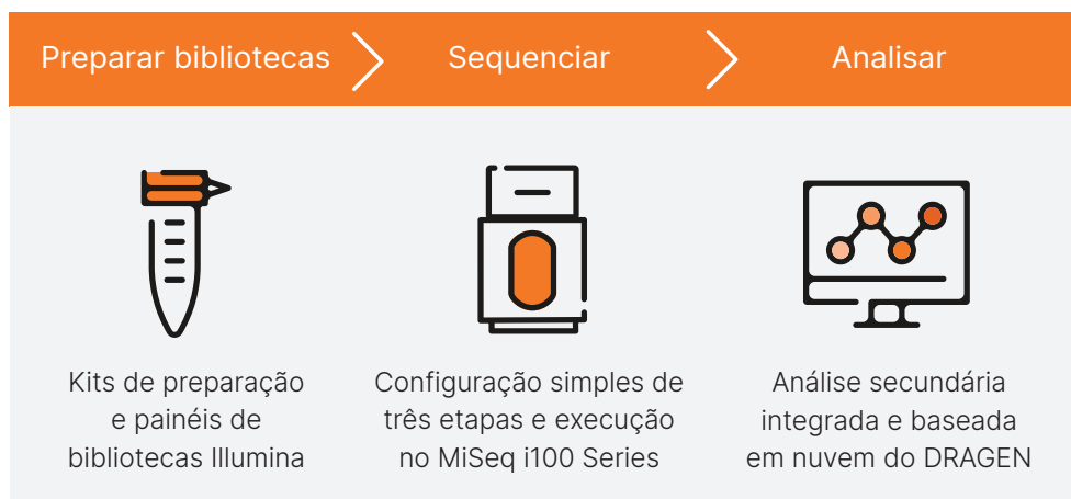
Figura 2: O MiSeq i100 Sequencing System e o MiSeq i100 Plus Sequencing System oferecem um fluxo de trabalho intuitivo e simplificado para facilitar a transição para o NGS.