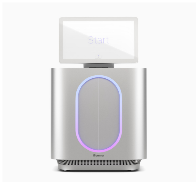
Figura 1: MiSeq i100 Sequencing System e MiSeq i100 Plus Sequencing System: a inovação da Illumina continua a ampliar o acesso ao NGS com sistemas de bancada projetados para a simplicidade e velocidade.

Na Illumina, a experiência do cliente está no centro de todas as inovações, facilitando a preparação de amostras, os sequenciamentos e a análise de dados. Cada aspecto do fluxo de trabalho do MiSeq i100 Series é otimizado para minimizar o tempo e os recursos necessários para a conclusão dos projetos (Figura 2). Os MiSeq i100 System e o MiSeq i100 Plus System oferecem um fluxo de trabalho simplificado com configuração de execução concluída em apenas três etapas e em menos de 20 minutos. Cartuchos de reagentes e materiais de consumo prontos para uso são enviados e armazenados em temperatura ambiente. Portanto, não é preciso esperar