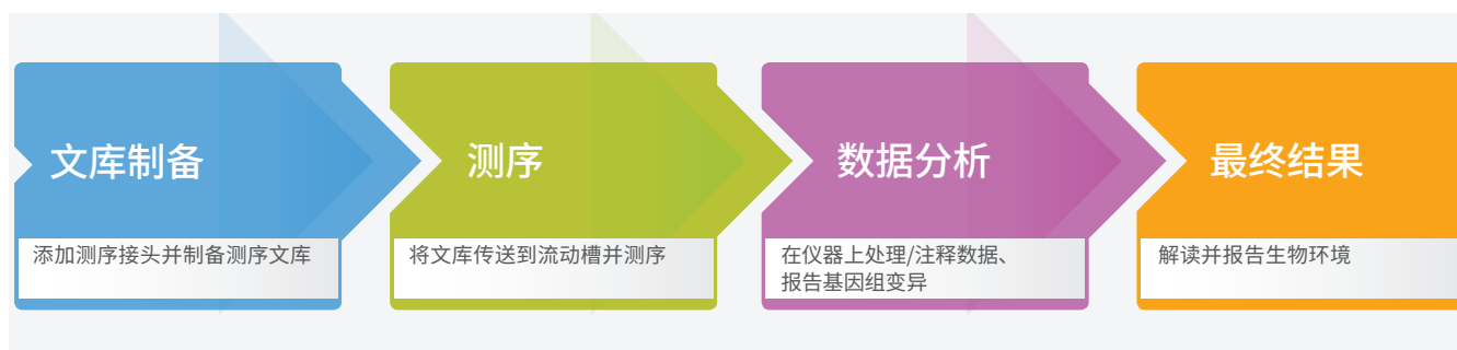
图 2: MiSeq 系统工作流程 — MiSeq 系统工作流程经过了简化，可为新一代桌上测序实现快速处理。可以使用任何兼容的文库制备试剂盒来制备文库。测序时间共五个半小时，包括在使用 MiSeq Control Software 的 MiSeq 系统上运行簇生成、测序、启用了双面扫描 (2 × 25 碱基对) 的评定质量分值碱基检出所花费的时间。

快速的文库制备过程和 MiSeq 系统的强大功能可以简化工作流程，加快处理速度 (图 2)，只需数小时而非几天即可获得结果。使用 Illumina DNA Prep 文库制备试剂只需三个小时即可制备测序文库，然后在 MiSeq 系统上只需 5.5 个小时即可完成自动化克隆扩增、测序和评定质量分值的碱基检出 (表 1)。序列比对可直接在机载仪器计算机上使用 MiSeq Local Run Manager 软件完成，或通过 BaseSpace Sequence Hub 完成，所需时间不到三个小时。