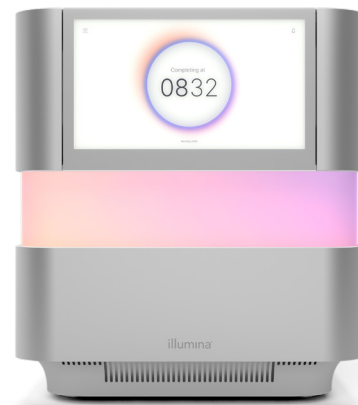
Figure 1 : NextSeq 2000 Sequencing System : NextSeq 2000 System offre des fonctionnalités de conception innovantes, une chimie avancée, une bioinformatique simplifiée et un flux de travail intuitif opérant la plus large gamme d'applications et offrant une souplesse d'adaptation sur un système de séquençage de paillasse.

Les systèmes NextSeq 1000 et NextSeq 2000 sont alimentés par la chimie XLEAP-SBS, une chimie de séquençage par synthèse (SBS) plus rapide, de qualité supérieure et plus fiable conçue à partir de la base éprouvée de la chimie de SBS standard d'Illumina. Les nucléotides XLEAP-SBS utilisent des marqueurs de pointe et de nouveaux lieurs et blocs qui sont plus résistants à la chaleur. Ils montrent également une hydrolyse réduite par un facteur de 50 et un clivage 2,5 fois plus rapide afin de réduire la mise en phase et la mise en préphase. La polymérase XLEAP-SBS est conçue pour incorporer plus rapidement les nucléotides et ce, beaucoup plus fidèlement qu'auparavant.