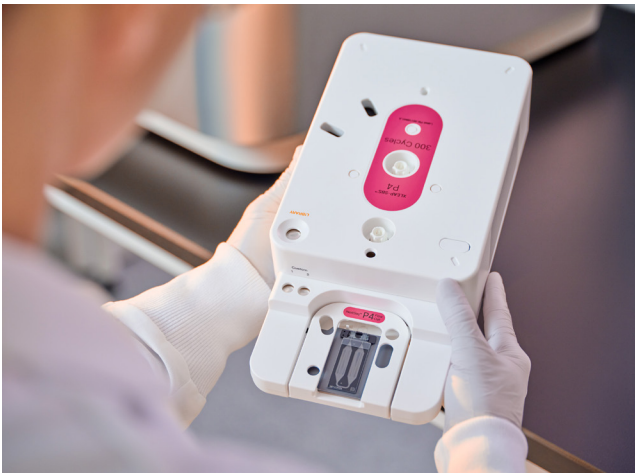
Figure 4 : Cartouche de réactifs NextSeq 1000 et NextSeq 2000 : la cartouche intégrée comprend les réactifs, la fluidique et le support de déchets. Décongelez et préparez tout simplement la cartouche de réactifs, insérez la Flow Cell, chargez la librairie et placez-la dans l'instrument.

Dans la mesure où les réactifs ne quittent jamais la cartouche, la conception de l'instrument sec ne nécessite aucun lavage, ce qui permet de simplifier la maintenance et d'optimiser le rendement de l'instrument.