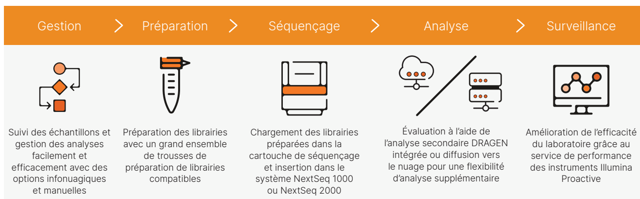
Figure 2 : Flux de travail intuitif de la librairie à l'analyse : les systèmes NextSeq 1000 et NextSeq 2000 fournissent un flux de travail complet qui comprend une configuration conviviale de l'analyse, le plus large ensemble de trousse de préparation de librairie compatibles, un fonctionnement de chargement-exécution ainsi que l'analyse secondaire intégrée.