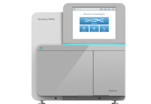
Figure 1 : L'instrument NextSeq 550Dx – en tirant parti des dernières avancées de la chimie de séquençage par synthèse et de flux de travail conviviaux et réglementés, l'instrument NextSeq 550Dx fournit des résultats de grande qualité tant pour les applications cliniques que pour les applications de recherche.

La chimie SBS d'Illumina exploite la compétition naturelle entre les quatre nucléotides marqués, ce qui réduit le biais lié à l'incorporation et permet un séquençage plus robuste des régions répétitives et des homopolymères 2 .