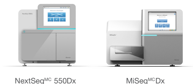
Figure 3 : Gamme d'instruments de diagnostic de SNG d'Illumina – Les systèmes de séquençage nouvelle génération d'Illumina proposent des solutions pour un vaste éventail d'applications, de types d'échantillons et d'échelles de séquençage. Ils fournissent tous des données de grande qualité, un degré d'exactitude élevé, de la souplesse sur le plan du débit et des flux de travail simples et rationalisés.

L'instrument NextSeq 550Dx est doté d'un logiciel d'analyse entièrement intégré, dont l'architecture modulaire est adaptable aux tests actuels et futurs. Le logiciel de contrôle de l'instrument est accessible par l'entremise d'une interface conviviale à écran tactile. Le logiciel Local Run Manager prend en charge la planification des analyses de séquençage, le suivi des bibliothèques et des analyses à l'aide des pistes de vérification et l'intégration avec les modules d'analyse de données intégrés. Pendant que Local Run Manager s'exécute sur l'ordinateur de l'instrument, les utilisateurs peuvent suivre les progrès de l'analyse et visualiser les résultats sur un autre ordinateur connecté au même réseau. Une fois l'analyse de séquençage terminée, Local Run Manager lance automatiquement l'analyse des données à l'aide de l'un des modules d'analyse propres à l'application.