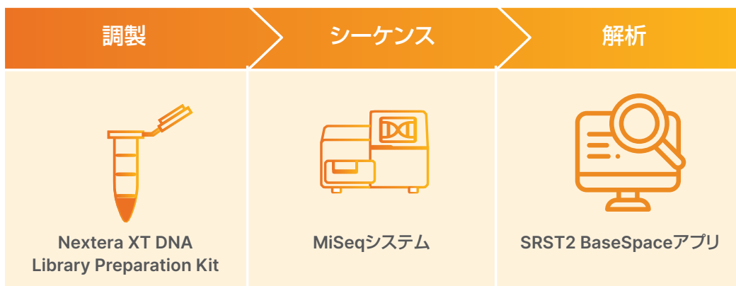
図1: HAIサーベイランスワークフロー: SRST2 BaseSpace アプリは、イルミナのライブラリー調製とシーケンスを含む、HAIサーベイランスのための包括的なNGSワークフローの一部です。